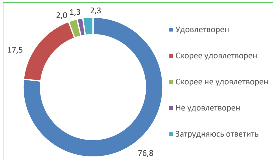
Диаграмма 4. Распределение ответов респондентов на вопрос «Удовлетворены ли Вы доброжелательностью и вежливостью работников организации, обеспечивающих первичный контакт с посетителями и информирование об услугах при непосредственном обращении в организацию?», %

При ответе на вопрос: «Удовлетворены ли Вы доброжелательностью работников организации, обеспечивающих непосредственное оказание услуги при обращении в организацию?», 96,7% респондентов удовлетворены. Расчетный балл по показателю – 96,7.