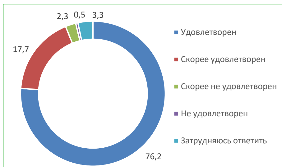
Диаграмма 3. Распределение ответов респондентов «Удовлетворены ли Вы комфортностью условий предоставления услуг в организации?», %

Итого, по критерию «Комфортность условий предоставления услуг» расчетный показатель составил 76,9 баллов.