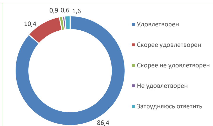
Диаграмма 6. Распределение ответов респондентов на вопрос «Удовлетворены ли Вы доброжелательностью и вежливостью работников организации, с которыми взаимодействовали в дистанционной форме?», %

Итого, по критерию «Доброжелательность, вежливость работников организации» расчетный показатель составил 95,8 балла.